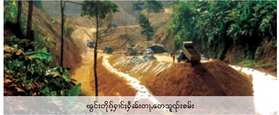
ဖွင်းတိုဂ်းရှမ်းတု၊ တေသူလ်းစမ်း

ဂူဆီးဝါဆီးဆေးရှီးလင်း ယင်းတိုဂ်းသိုပ်၊ တုဂ်းယွဆွဲရှုံးသိုဂ်းမားကပ်ပဆီးဖွဲဆွဲလင်း ရှင်ယိုဝ်း လင်းသမ်သီဂ်းဂါမ်၊ ဂျ၊ စလးရှုံးဖေးရှိတ်းဖေတ်းလုံးစာမ်၊ ရှပ်ဖေတ်းလွ မ်းပိုင်းတြးမံမီး တေ၊ ထိုင်ယမ်းလီဝ်။