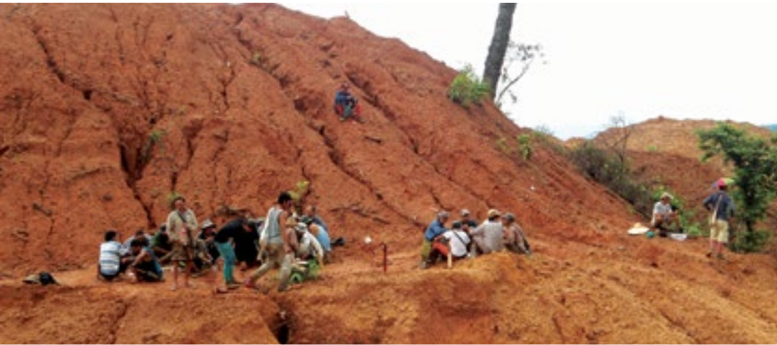
ရှမ်းဝါဆိးဆေးရှ်းလူင် ကွဆိကဆိခိုဆိးသူ, လိုဝ်းပိုဆိးတီးစုတ်းစမ်း