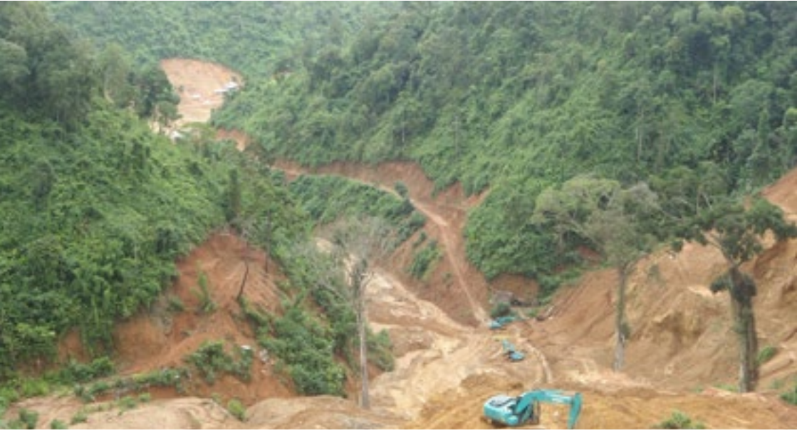
ရှိုတ်းလွင်စုတ်း ကမ်းတိုက်.လွင်စုတ်းစမ်းတီးပိုဆီး.တီးစုတ်းစမ်း