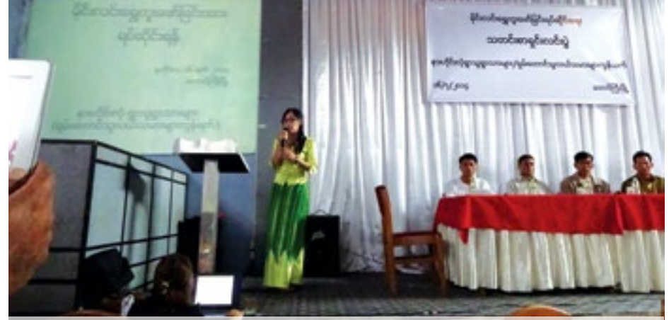
ပင်သင်းလီင်းစာပ်၊ ပီးဆွဲဝါဆီးဆေးရှီးလင်း တီးဝိုင်းတူဆီးတီး