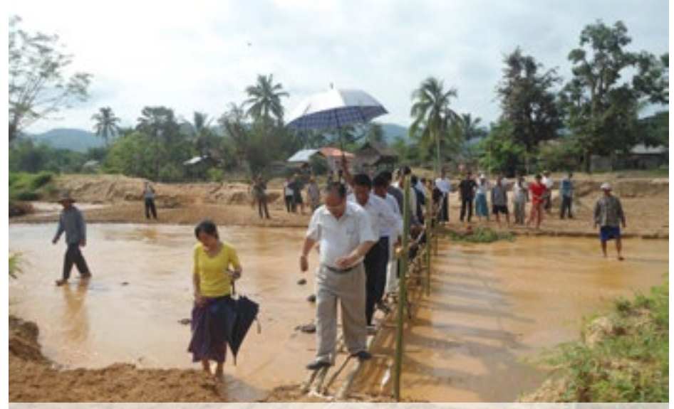
ဖွင်းလူင်ဗွဲ၊ ဗု၊ မံ. ခလး မိုင်းစုတ်တံး လံးကျားပဝ်း လေ၊ ယိမ်းဝါဆီးဆေးရှ်းလူင်