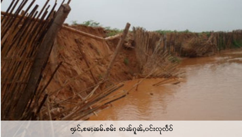
ဖွင့်၊ စမးဆမ်.စမ်း ကမ်ဂူဆမ်၊ ပင်းလုလီပ်

ဝံးလံးကံးပင်းလိသင်၊ ရှိုင်းစွမ်းပဆီးစပ်စိုဆီးမေးပဆ်စမးဆမ်.စလးတီးလိဆ်ရှိုး ဆေးယပ်. စွမ်းပဆီးစပ်ဂေးဖွမ်.လွမ်းသေစိုဆီးလံးမေးပဆ်သံးစမး ဆမ်.စမ်း မွတ်း 4,400 ထတ်းကမ်လံလူင်းလွမ်းဝါဆီးဆေးရှိုးလူင်လူင်းတေးထိုင်စမးဆမ်. လီဆီးဆမ်.ယူယပ်.။ ဆွဲမေးလံးလံးဆမ်.ပးဝံ.ဝး လံးတိပ်. စလး လွံစမ်းလူင် တေလံးစိုဆီးမေးပဆ်စမးဆမ်.တေး၊ 40%၊ လံးသံးပျိုင်းစလးသမ်.တေလံးစိုဆီး မေးပဆ်တေး၊ 20%။ လွင်လီဂ်၊ စဖေပဆ်ဂမ်လိုင်.ဆံ ဆံ.ကပ်လွမ်းစေးလံးလံးတမ် ဂမ်စုတ်းစမ်းစွမ်းပဆီးစပ်ဆမ်.ယပ်.။ လံးတိပ်.စလးလွံစမ်းလူင်စတ.မီးစေး ဆွင်၊ သီ၊ စေးစလးလံးသံးပျိုင်းစလး သမ်.ဂူလ်းမီးသွင်စေးဂူလ်း။