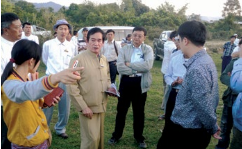
ဖွင်းလူင်ဗွဲ၊ ဗု၊ မံ. ခလး မိုင်းစုတ်တံး လံးကျားပဝ်း လေ၊ ယိမ်းဝါဆီးဆေးရှ်းလူင်