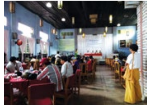
မိုင်းဖွင်းပီးဆွဲဆေးရှီးလင်းရှင်ထုပ်း လင်းလံးကံးပပ်း ဖွင်းလင်းဖမ်းမိုင်စတုး

မံ၊ တွင်း။ သိုဂ်းမားကမ်ယိုဝ်းလင်းသမ်ဆဆ် ယူ၊ တီးတပ် စမယ 330 မိုင်းဖျေဂ်း။ သိုဂ်းမားစပ်ဆွဲတပ်မိုင်းဖျေဂ်းဆ် လုံးပဆ်၊ ပုတ်းဂါဆီးစပ်းစပ်းကွက်၊ ကွက်၊ ဆွဲမိုင်း- လီဆီး 3 လို့ဆ် ကမ်၊ ဆဆ် 6 လို့ဆ် 1 ပွဂ်း၊ သိုဂ်းမားဂျ၊ ရှိတ်းတပ်ပဂ်းယူ၊ တီး- းဆိုင်လွဲစမ်း ကပ်ရှမ်းလုမ်းဂါဆီးစုတ်းစမ်း။