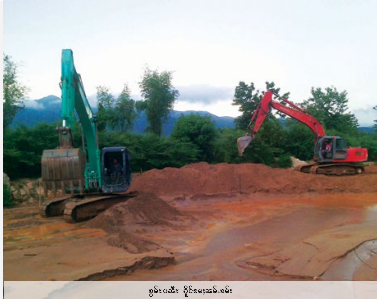
ခွမ်းပဆီး ရှိုင်ငမးဆမ်.စမ်း