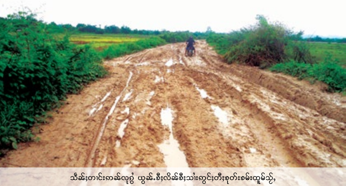
သီဆီးတင်းကမ်းလှည့် ယွမ်းစီးလိဆီးစီးသီးကွင်းတီးစုတ်းစမ်းထူမ်သို့

စလးဝီင်းစပ်လှိုင်းလွမ်းဆဆီး. မဆီးလတ်းတီးဂူမီးဝါဆီးဝါး; ကမ်, ထုတ်, လီမုင်းမွင်း တုတ်းယွမ်းဂါးသီးတီးဆီးသင်ထီင်းယပ်.။ လှိုတ်ဆဆီး. မဆီးယင်းပံးလီ. ဖေးဂူမီး ဝါဆီးဝါး တိုဆီးတင်းလှိုတ်, နှိုတ်းလီဆီးစီးဆေး ကမ်, လင်းဖုတ်, သွမ်းသင်ဂူလှိုင်း ယွမ်းစီးလံးဂိုဆီးသီးတီးဆီးဆီထီင်းသေ လှိုတ်, ဂူမီးဝါဆီးဖုတ်, သွမ်းဆေးစပ်စိုဆီး။