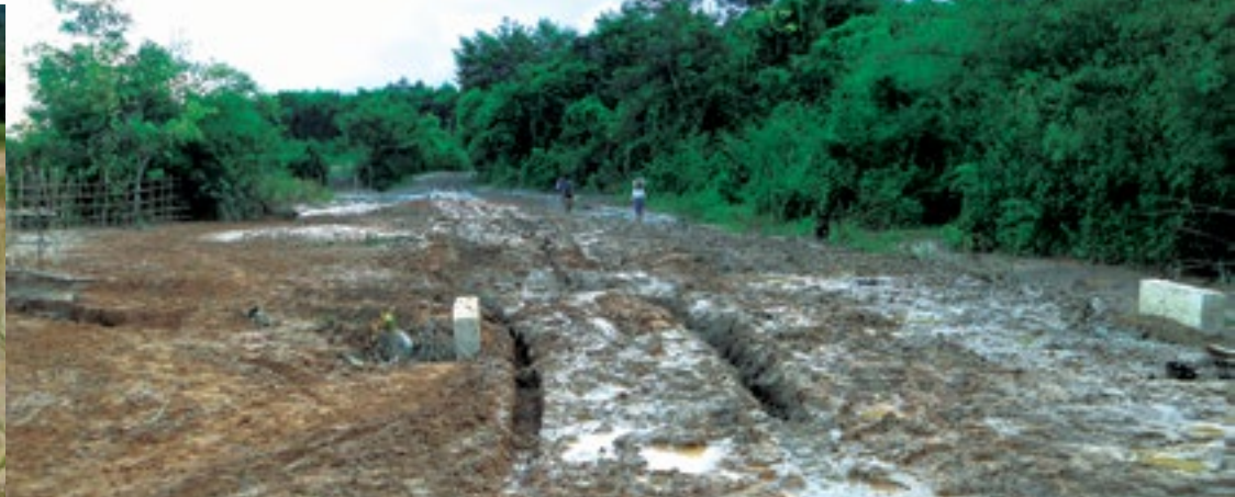
တီးလိမ်ရှပ်ဆေး ကမ်လှိုင် ယွမ်.စီးလိမ်စီးသီးကွင်းတီးစုတ်းစမ်းထုမ်သိုင်း