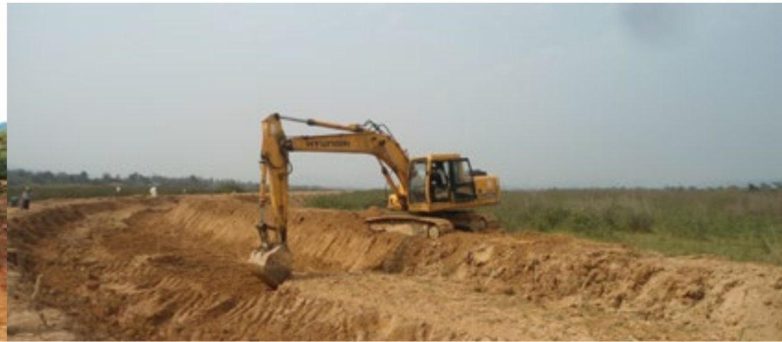
ဖွင်းတိုက်.စုတ်းလူင်စီးလိဆိးဆွဲးစမးဆိမ.စမ်း

ဆွဲးလွမ်းပျားတိုက်ဆိ. စဆပဆိစေးမုဆိးလိုဝ်းရှမ်းဝါဆိးလံးဂီဝ်းရှမ်းတွမ်မုးလိုဝ်းဂီဝ်, ရပ်းလွင်းတူင်.ဆိုင်စုတ်းစမ်းတီးဆွဲးပိုဆိးတီးလွံးစမ်း တံးဖွင်းလူင်ဖှံ, စုတ်းမိုင်းစုတ်း လံးကားပပ်းလိသင်,ရှ်းရှိတ်းယင်.ဂါဆိစုတ်းစမ်းဆဆိ.ယူ,။ ဆွဲးစုတ်းလိဆိကေး ဂါတ်. 2014 စလး ဆွဲးလိဆိမေ, 2015 လိုဝ်းဆိ. ရှမ်း ဝါဆိး လံးဂျာ,ရှပ်,ထတ်း တူလ်းဆွဲးပိုဆိးတီးစုတ်းစမ်းလိုဝ်းဆဆိ. 11 ပွဂ်းသေ တူလ်းလွမ်းငဝ်းလံးဂါဆိစုတ်း စမ်းကဆိရှမ်းပျားလွမ်းလဝ်းဆေးတီး လူင် ပွင်လိုင်းစပ်ဆဆိ.ပွဂ်းဆိုင်,။ ဆွဲးလွမ်းစေး မတ်းမံဆိ.ဂေးယင်းလိလိင်;စဆပျားလွင်းကဆိလဝ်းဆေးတီးလူင်ပွင်လိုင်းစပ် လူင်းလေ,တူလ်းဆွဲးပိုဆိးတီး စုတ်းစမ်းဆွဲးလိဆိကွဂ်းလူင်ပိုဝ်း 2014 ဆဆိ.သေ လူလွမ်းတူလ်းလွမ်းငဝ်းလံးမဆိဆဆိ.ယူ,။