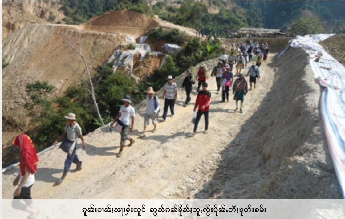
ဂူဆင်းဝါဆ်းဆေးရှ်းလှိုင်း ကွက်ဂါဆ်းစိုဆ်းသူ၊ လှိုင်းပိုဆ်းတီးစုတ်စမ်း

ထိုင်ဂမ်းလိုဆ်းသူတ်းမဆ်းမား လှိုင်းရှိုပ်ဂေးလီ တာမ်တုပ်လံးကံးပမ်းလံးလှိုင်းလေ၊ ယ်းမီးတုလှိုင်းဝါဆ်းဆေးရှ်းလှိုင်းမိုင်းဝမ်းထိ 28/05/2015 ပွန်းကွက် တာင်းသူတ်းတု၊ မဆ်းသေ မဆ်းလာတ်၊ လှိုင်းစပေဂူဆ်းဝါဆ်းဂူဆ်းမိုင်းတု၊ တုပ်မဆ်းစတု၊ တိုဆ်းကမ်၊ လာင်းရှာမ်းတပ်၊ ရှိုင်းဂါဆ်းစုတ်စမ်း တီးလှိုင်းဆံ့။ ရှိုတ်းယိုတ်းလံး ရှပ်ပိုင်းတု၊ စွမ်းပဆ်း လှိုင်းဆံ့လံးရှာင်းတု၊ သိုပ်၊ စုတ်စမ်းတီးဆေး၊ ပီးတု၊ မားဆံ့ယပ်။ လှိုင်း ဆေးမဆ်းယင်ပံလာတ်၊ ရှိုင်းဝါဆ်းလှိုင်း ရှိုင်းဂါဆ်းသမ်စုတ်းဂါဆ်းစုတ်စမ်းတု၊ “ယု၊ သာင်းပဆ်းရှာထိုင်၊ ယပ်။” မဆ်းဂေးလှိုင်းဂူဆ်းဝါဆ်းတိုက်မားယပ်။ တု၊ ဆံ့။