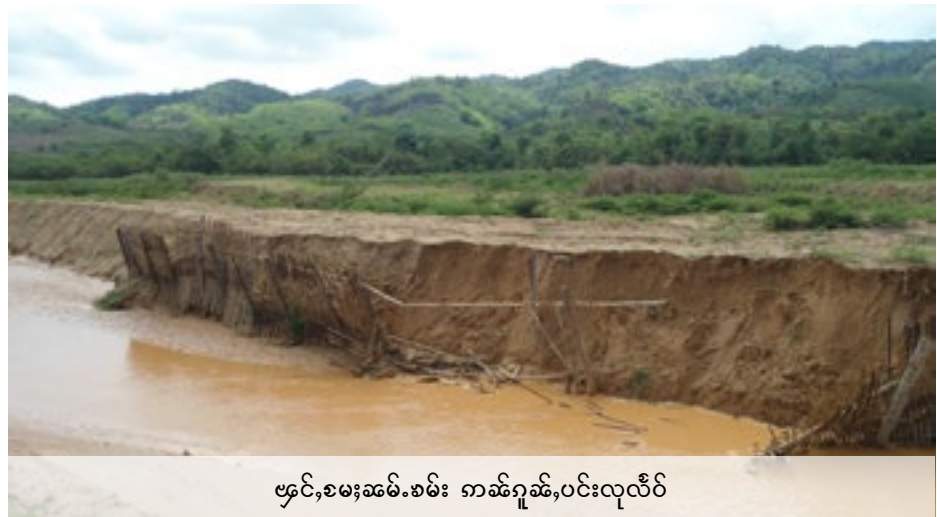
ဗြင်,စမးဆမ်.စမ်း ကမ်ရှမ်း,ပင်းလုလီပ်

ပိုဝ်းတု,တေသိုဝ်,တုဂ်းယွမ်းတမ်စော့တုဂ်းယွမ်းရှမ်းဝါဆီးကမ်ရှုံးရှိတ်ဂါဆိ စုတ်းစမ်းဆဆမ်. ရှမ်းဝါဆီးလုံးဂီပံးရှမ်းစော့မုဆီးလှိုင်တင်းလှိုင်ရှိတ်, စိုဆီးပီဆိ မုးဆွဲစပ်းတင်းသမ်ပီပံးဆဆမ်.သေ ရှိတ်းကွဂ်,ပီဆိဗိုဆိပပ်.ကွဆိ,ဗိုဆိဆိ.ယပ်.။