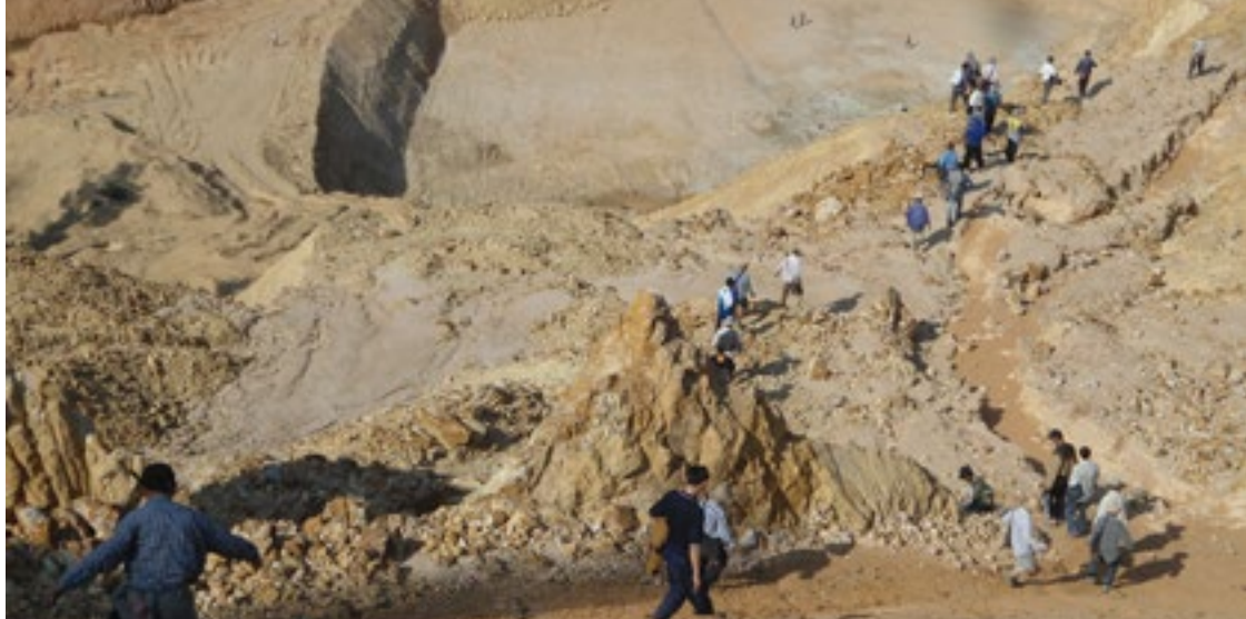
ရှမ်းဝါဆီးဆူးရှုံးလှိုင် ကွဆိကမ်စိုဆီးသု,လှိုင်ပိုဆိ.တီးစုတ်းစမ်း